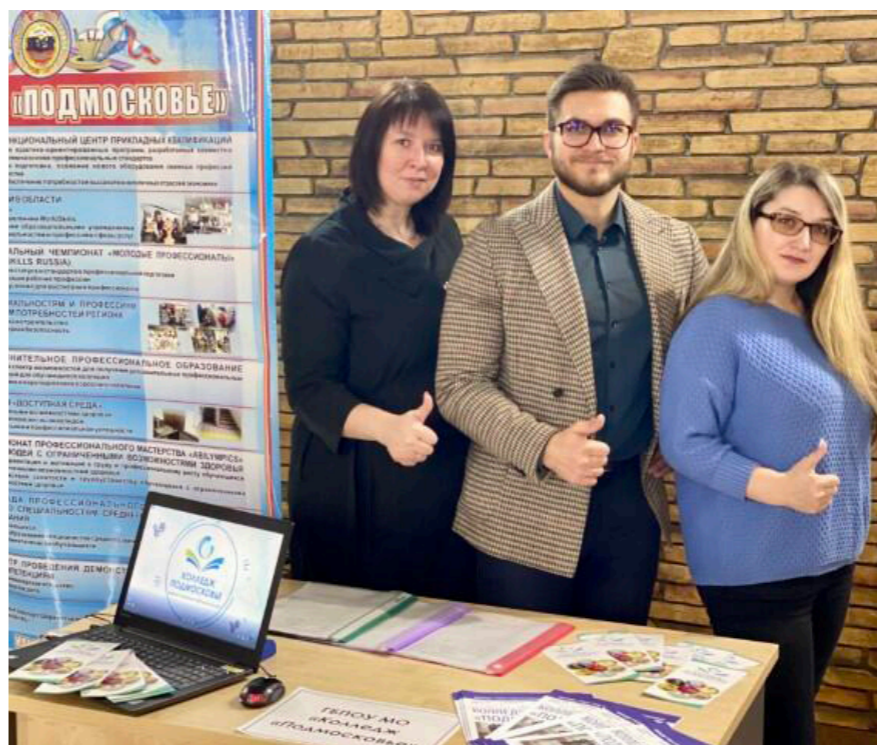
ДОБРО ПОЖАЛОВАТЬ В НАШ КОЛЛЕДЖ!

«КОЛЛЕДЖ «ПОДМОСКОВЬЕ» ПРИНЯЛ УЧАСТИЕ В ЯРМАРКЕ ВУЗОВ И СУЗОВ, КОТОРАЯ ПРОХОДИЛА В МДЦ «СТЕКОВЫЙ» Г.О. КЛИН. ЯРМАРКУ ПОСЕТИЛИ РОДИТЕЛИ И БУДУЩИЕ АБИТУРИЕНТЫ. ВЫБОР ПРАВИЛЬНОГО «ПУТИ» ПОСЛЕ ОКОНЧАНИЯ ШКОЛЫ – ЭТО КРАЙНЕ СЕРЬЕЗНЫЙ, СЛОЖНЫЙ И ОТВЕТСТВЕННЫЙ ШАГ. ДУМАЕМ, ЧТО НАШ КОЛЛЕДЖ ЗАИНТЕРЕСОВАЛ МНОГИХ АБИТУРИЕНТОВ, И ОНИ СМОГЛИ НАЙТИ ТО НАПРАВЛЕНИЕ, КОТОРОЕ ПОМОЖЕТ РЕАЛИЗОВАТЬ ИМ СВОИ МЕЧТЫ И НАДЕЖДЫ. ПРИГЛАШАЕМ В КОЛЛЕДЖ «ПОДМОСКОВЬЕ» ПОЛУЧИТЬ ВОСТРЕБОВАННУЮ СПЕЦИАЛЬНОСТЬ.